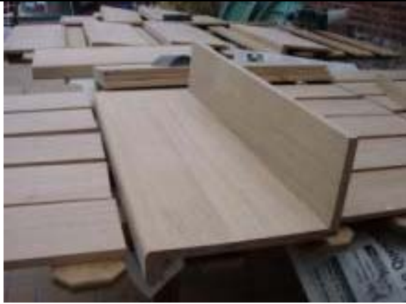
Marche et contre marche