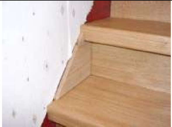
Patron pour cacher le limon