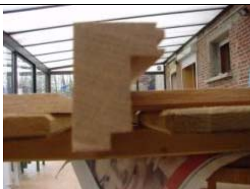
Nez de marche : cette forme lui permet de reposer sur la marche