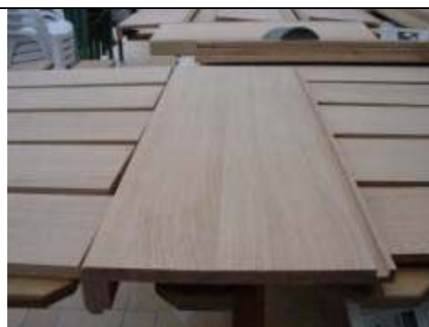
Marche assemblée avec le nez de marche (on remarque, à droite, la rainure (10 mm de large, 5 mm de profondeur) pour encastrier la contre marche